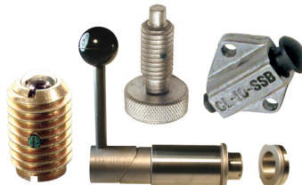
Posicionadores con Resorte