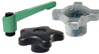
Manijas y perillas