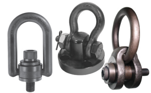
Anillos para Levantar