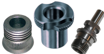
Bujes de Perforación