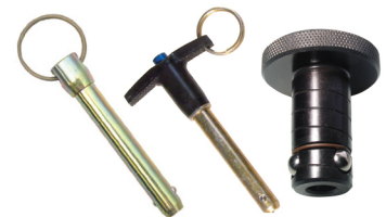
Pasadores de Alineación