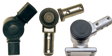
Cubos de Cierre Ajustables